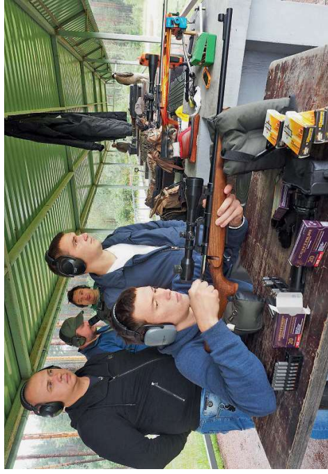
В процессе стрельбы оружие смогли опробовать и представители оружейного магазина «Барс»

При этом «Барс», с учётом готовности к стрельбе «из коробки» (наличие приведённого к нормальному бою на заводе механического прицела), заметно дешевле «Орсиса». А если рассматривать исполнение в берёзовой ложе, то ижевский карабин вообще относится к другой ценовой категории, где у него нет конкурентов на современном российском оружейном прилавке.