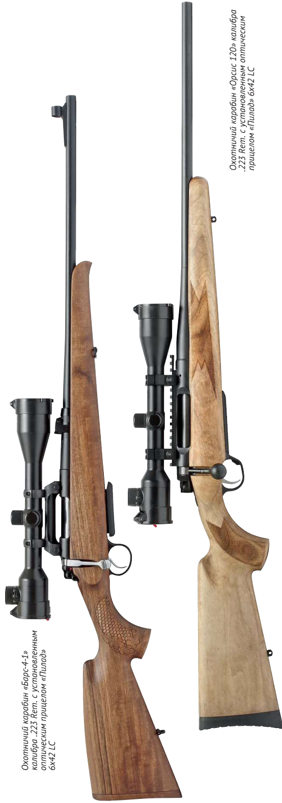
Охотничий карабин «Барс-4.1» калибра .223 Rem. с установленным оптическим прицелом «Пиллад» 6х42 LC