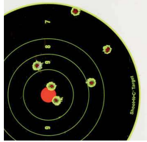
Результаты стрельбы из «Барса» лёгкими (верхние группы) и тяжёлыми пулями (патроны Атмосг). Масштаб 1:2