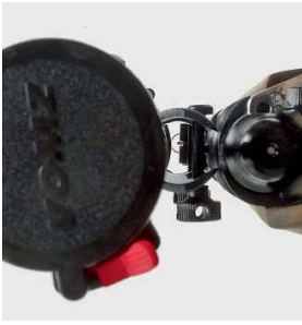
Используемый для установки оптики на «Барс» кронштейн обеспечивает возможность использования механического прицела — это несомненный плюс

эксплуатации. Созданный полвека назад «Барс» легче, но «Орсис» — точнее. «Орсис» изыскан по качеству изготовления, а «Барс» — по внешним формам.